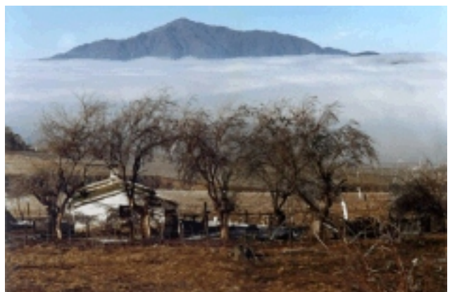
Iº premio- categoría analógica -"Paisaje Irreal" por Julio Güell

Con las fotos premiadas y aceptadas se realizó una muestra fotográfica, la cual puede visitarse gratuitamente en el la sala de Artes Visuales, Facultad de Ingeniería.