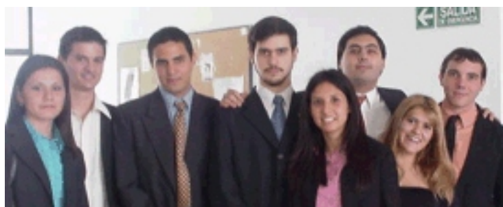
Algunos de los alumnos que finalizaron el curso IBM y recibieron su diploma

La Calificación Profesional representa una habilidad puntual que los estudiantes adquieren sobre una cierta herramienta de software IBM, al aprobar una o dos materias utilizando dicha herramienta durante los trabajos prácticos y/o proyectos desarrollados durante el cursado de las mismas.