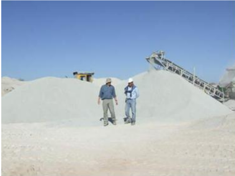
2) Planta en Colonia Caroya (1) (Córdoba)